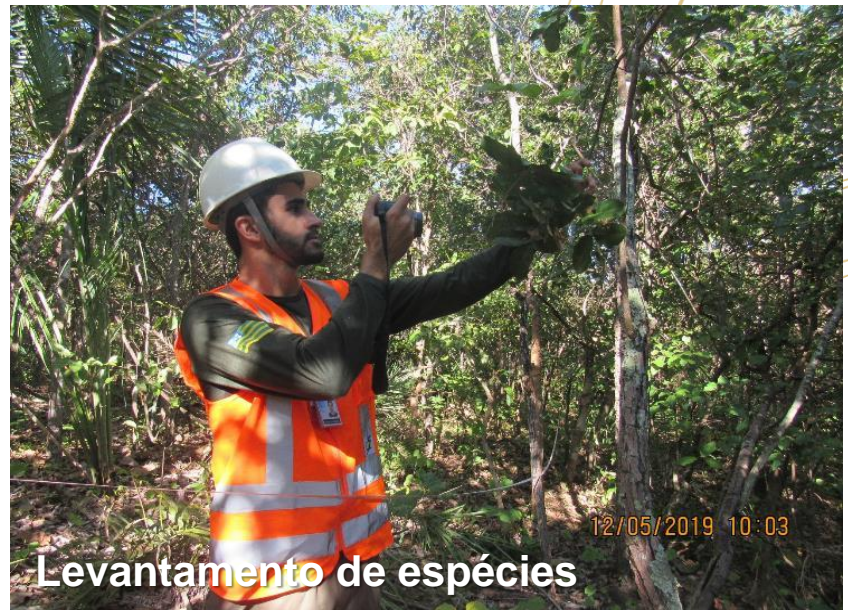
Levantamento de espécies