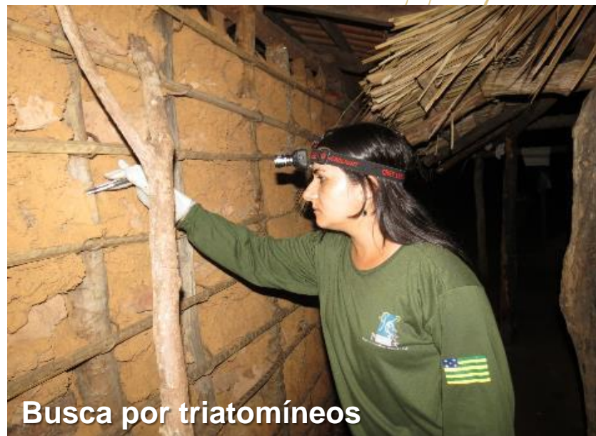
Busca por triatomíneos